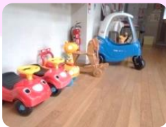
乗り物に乗って のびのび遊べる♪