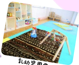
乳幼児用の おもちゃが充実♪