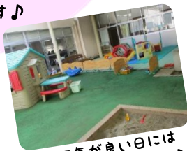
お天気の良い日には テラスやお庭遊びも♪