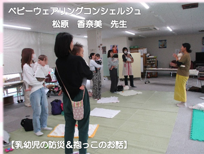
【乳幼児の防災＆抱っこのお話】