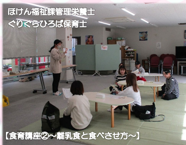
【食育講座②～離乳食と食べさせ方～】