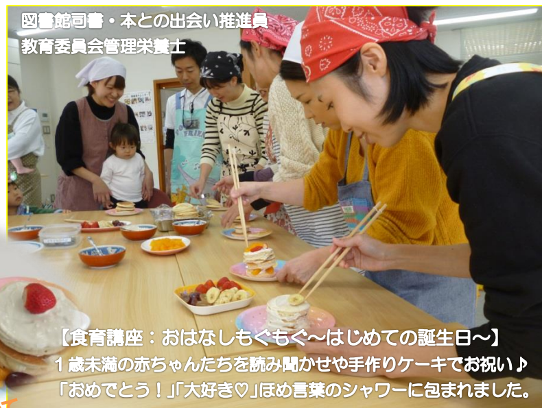
図書館司書・本との出会い推進員 教育委員会管理栄養士

【ベビーウェアリング~心地よい抱っこについてのお話&実践】 「抱っこやおんぶは赤ちゃんと保護者の共同作業」と講師の先生。 日頃使っている抱っこ紐やスリングで、心地よさを体験しました。