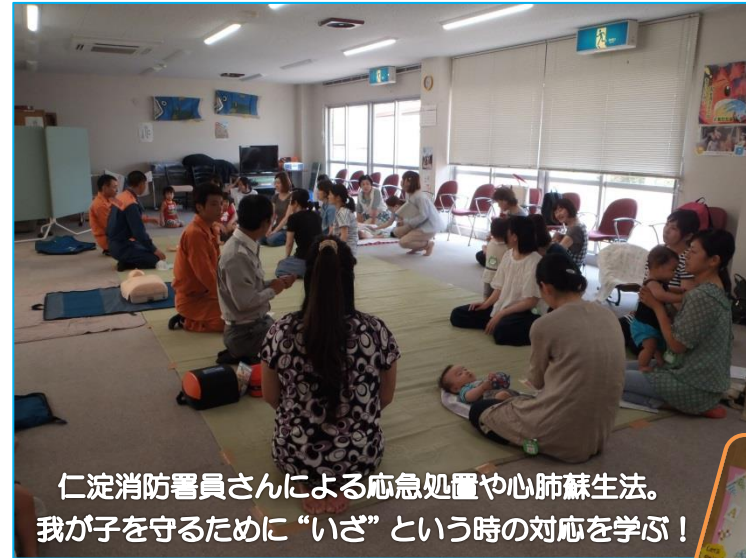
仁淀消防署員さんによる応急処置や心肺蘇生法。 我が子を守るために“いざ”という時の対応を学ぶ！