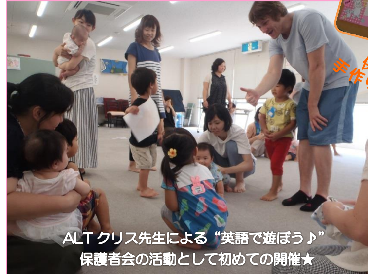
ALT クリス先生による“英語で遊ぼう♪” 保護者会の活動として初めての開催★