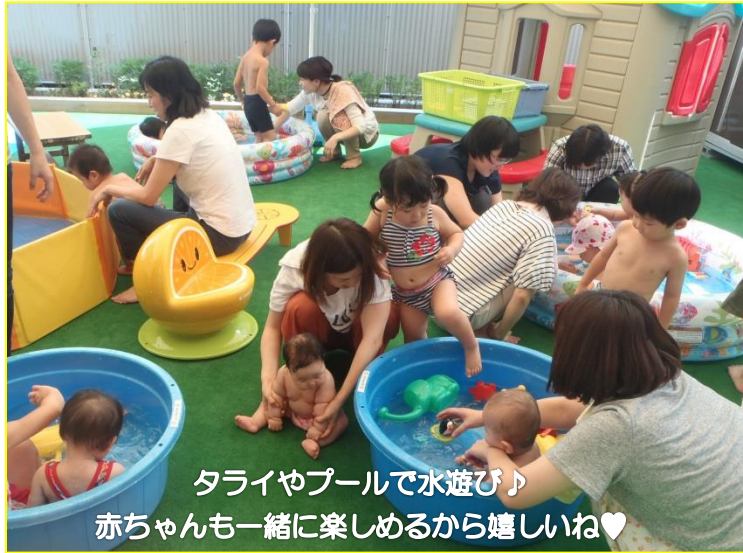
タイヤプールで水遊び♪ 赤ちゃんも一緒に楽しめるから嬉しいね♡