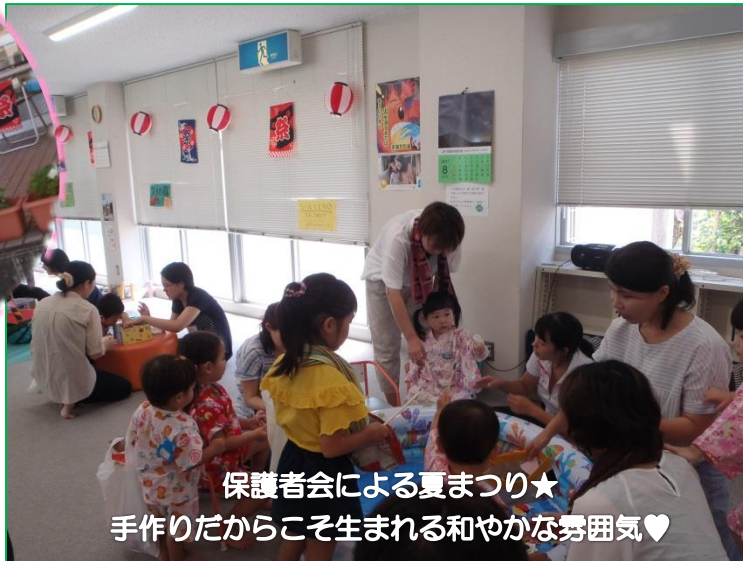
保護者会による夏まつり★ 手作りだからこそ生まれる和やかな雰囲気♡