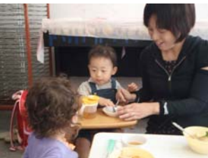
遊んだいご馳走になったい♡ 園長先生をはじめ、園の先生方や、 給食の先生、園児の皆さんに感謝します★ 本当にお世話になりましたありがとうございました★