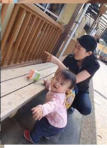
園庭にも誘っていただきました♪ 大型遊具や砂場、フランクなど 楽しい遊具がいっぱい☆ 親子ともに大興奮でした♡♡♡