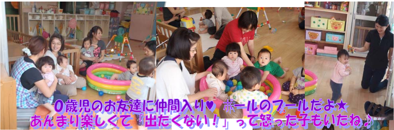
0歳児のお友達に仲間入り♡ ホールのフールだよ★ あんまり楽しくて「出たくない！」って怒った子もいたね♪