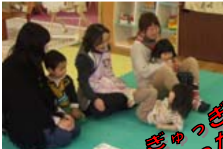
ぎゅっぎゅっ♡ ぎゅら〜っが大好き♡ ママが大好きだもん♡