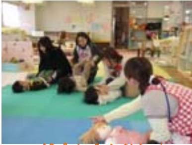
絵本とおんなじ♪ 足と足でキックキック♪ お尻とお尻でぽよんぽよん♪