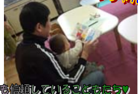
あおくんときいろちゃん

ぐりぐらのパパ、私に読んで♪ひろばの大人なら誰でも信頼している子どもたち♡ 誰の子どもにも親切な保護者のみなさん♡♡ぐりぐらひろばの宝です♡