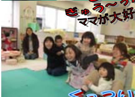
くっついた♪くっついた♪ ママと仲良しだもんね♡