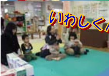
絵本読んでくれてありがとう♪ パチパチパチ!

職員の大好きな絵本を読みま した。読み聞かせによって子ど もの発見や気づきに感激したり、 経験や成長に伴い、読み込 むほどに絵本は益々魅力的な存在 に！読み始めると遊んでいた 子も視線を向け聴き始めます。 ブラインドを下ろして落ち着いた 雰囲気の中、ひろばはしつ とりとした空気に包まれました。