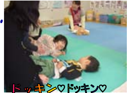
ドッキン♡ドッキン♡ えへへ♪おともだちと 目が合うと楽しさ倍増!!