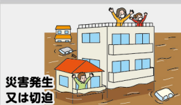
災害発生 又は切迫