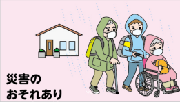
災害の おそれあり