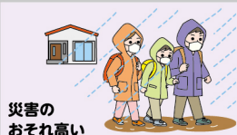
災害の おそれ高い