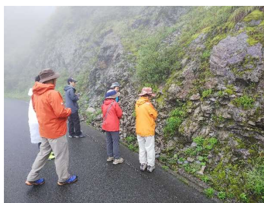
石鎚山系連携協議会による 瓶ヶ森フラワーウォッチングツアー