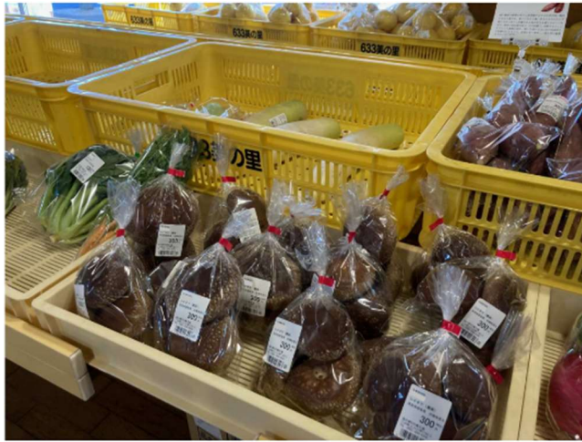
林産物販売施設 道の駅「633美の里」