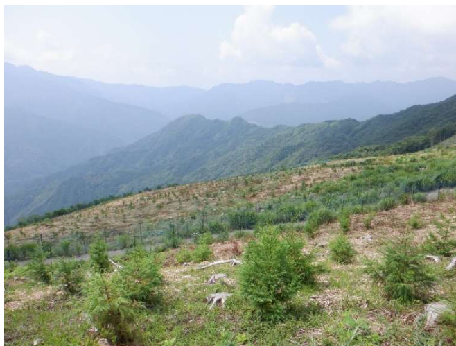
本川地区の再造林地

人工造林については、植栽によらなければ適確な更新が困難な森林や公益的機能の発揮の必要性から植栽を行うことが適当である森林のほか、木材等生産機能の発揮が期待され、将来にわたり育成単層林として維持する森林において行うものとする。