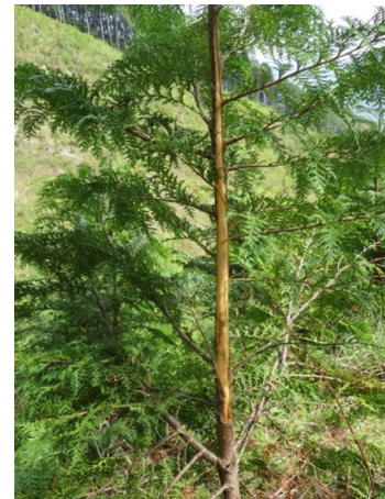
シカによる森林被害