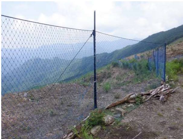
鳥獣害防護ネット

また、町、県、林業事業者等関係者が連携して鳥獣害の早期の把握に努めるとともに、捕獲推進のための報奨金制度、狩猟免許取得に対する補助制度、町長に指名された町職員が捕獲に従事できる制度を活用し、鳥獣害の防止に向けた取組を推進することとする。