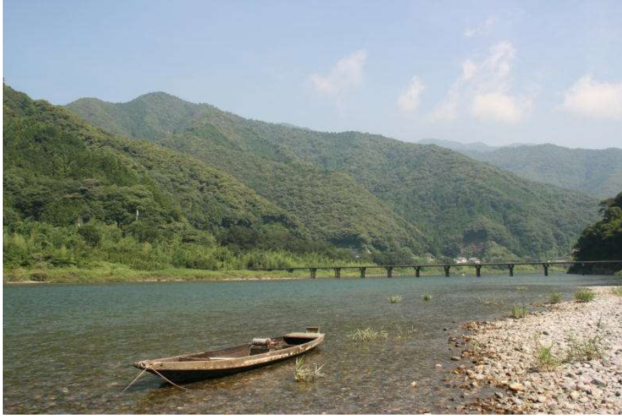
清流「仁淀川」と本町の山並み