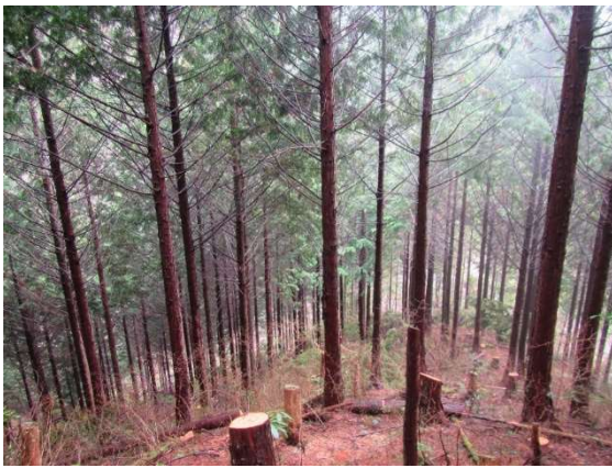
保育間伐後の林分

列状間伐に当たっては、林地の傾斜方向に合わせて伐採列及び列の幅を設定するものとし、伐倒の際は元口を搬出機械方向とすることを原則とするほか、伐倒木の落下防止に最大限の注意を払うこととする。1回の間伐として伐採する率は、伐採列数と残存列数による本数間伐率で、3残1伐～2残1伐による本数間伐率25～33%とする。また、伐採列1列あたりの幅は、標準地調査による1haあたりの現存本数から算出した樹間距離のおおむね2倍以内とすることを標準とする。