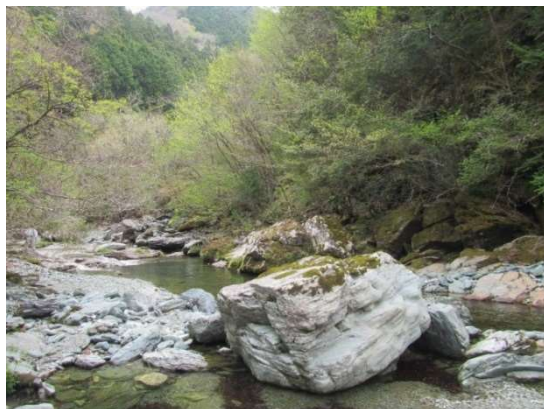
本川地区吉野川水系の景観