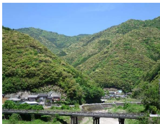
伊野地区の里山地域