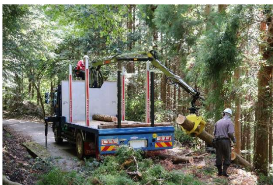
伐採木の搬出現場