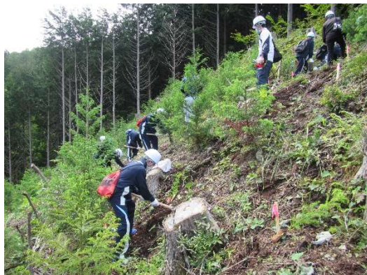
総合的学習の時間を利用した 森林環境教育（植樹体験）

日常生活において森林・林業と関わる機会が少なくなっている中で、主に子ども達を対象とした植林や間伐などの森林づくり活動を通じて、森林・林業について学習する「森林環境教育」を推進するとともに、地域の植樹、樹木保全、里山保全等の活動へ支援を行い森林を地域全体で支える意識の醸成に努める。なお、所有者と町との協定締結に基づき、当該私有林を森林環境教育用のフィールドとしても活用している。