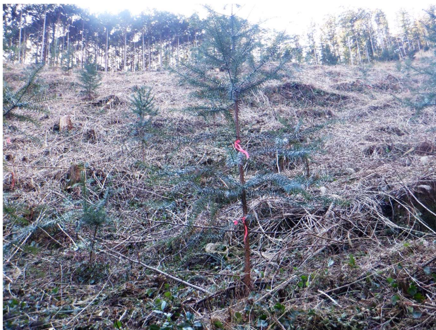
試験地に植栽されたコウヨウザン

早生樹であるコウヨウザンの生育適地における指針は、各項注意書きによるほか「コウヨウザンに関する技術指針（暫定版）（高知県林業振興・環境部 令和3年3月）」による。