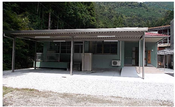
林産物栽培拠点施設 集落活動センター「氷室の里」