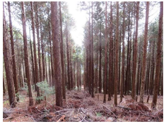
列状間伐後の林分