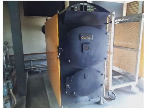
木質バイオマスボイラー