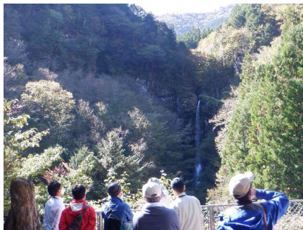
国立研究開発法人森林研究・整備機構 森林総合研究所との取組