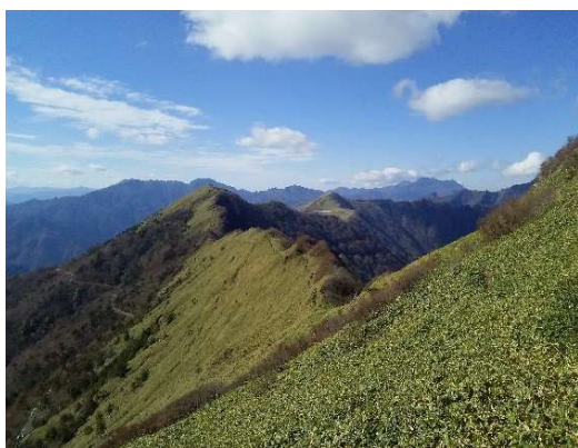
本川地区の山岳地帯

本町では、戦後営々と続けられてきた造林の推進により、私有林の人工林面積は20,107ha（人工林率66%）、蓄積は11,330千m 3 と量的には充実している。これら人工林については、引き続き間伐、保育等の森林整備の推進とともに、主伐、植林のサイクルによって均衡のとれた齢級構成に誘導することが必要である。そのため、地域住民の要請等を踏まえた地域に適した多様な施業の実施を担保しつつ、施業の集約化による効率化を図るためのツールである森林経営計画の作成を推進する等により、林業生産活動の活性化を図らなければならない。また、令和元年度より森林環境譲与税を活用し、森林の土地の境界確認や森林所有者への意向調査・境界明確化をはじめとし、放置竹林対策を柱とした里山整備、林業担い手の確保と育成に向けた支援、公共施設等の木質化、森林環境教育の充実等、様々な取組を行っている。今後とも地域課題の解決に向けた本町独自の取組を推進していく。