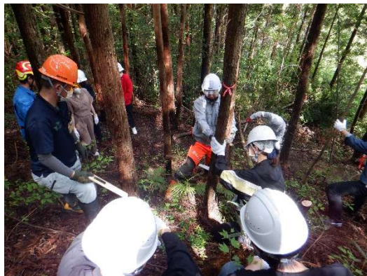
環境先進企業による林業体験

また、高知県製紙工業会、仁淀川漁業協同組合が実施する植樹活動への支援を実施することで、町の基幹産業である製紙業の振興と、水資源の保全に資するなど今後とも上下流連携による森林づくりの取組の推進に努めることとする。