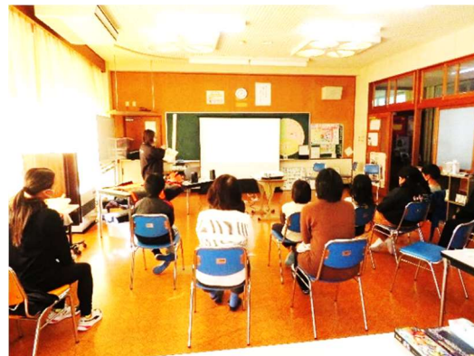
町内の小中学校での森林環境教育