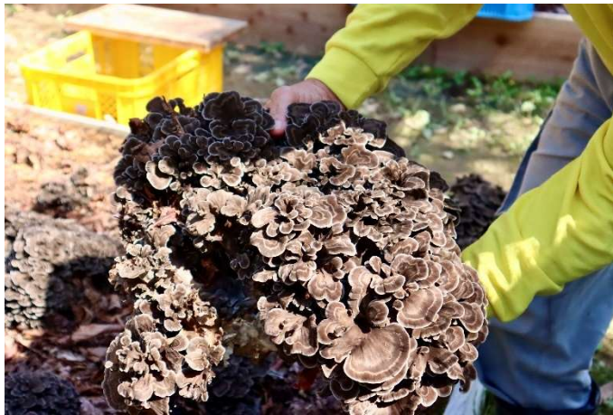
「氷室の里」で収穫された舞茸