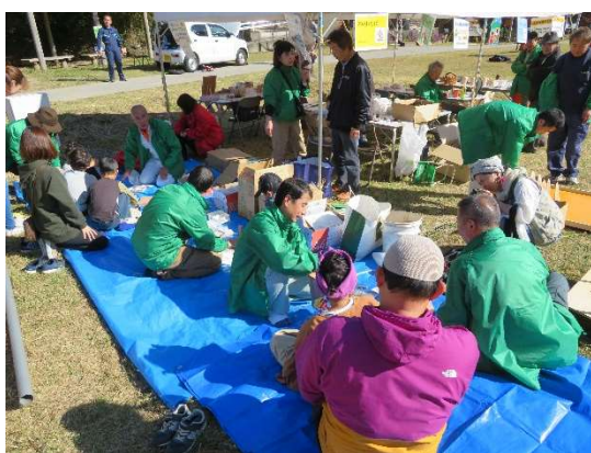
程野森林公園内でのイベント