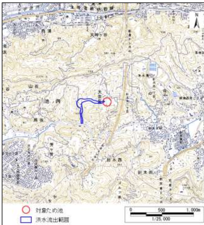
【簡易被害想定 (大奈路)】