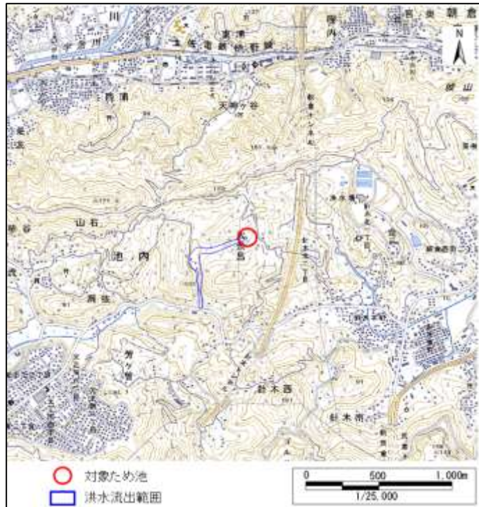
【簡易被害想定 (シシブチ)】