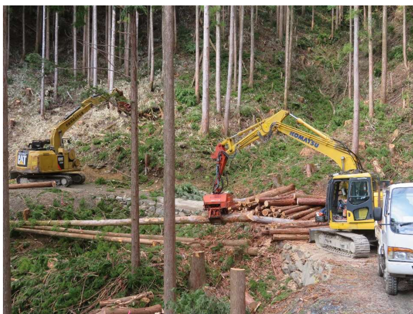
高性能林業機械による森林整備