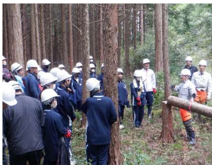
森林環境教育（間伐体験）