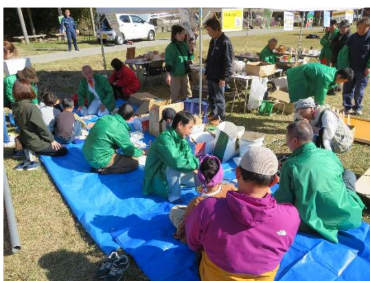
程野森林公園内でのイベント