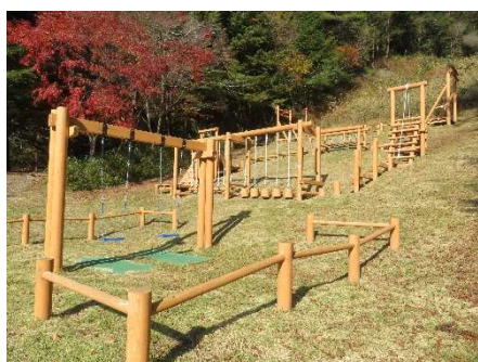
森林環境譲与税で整備した木製遊具