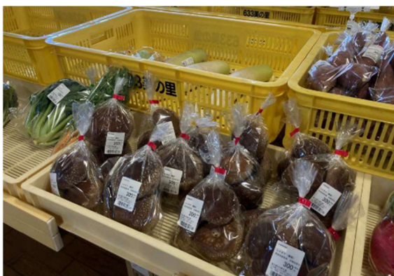
林産物販売施設 道の駅「633美の里」