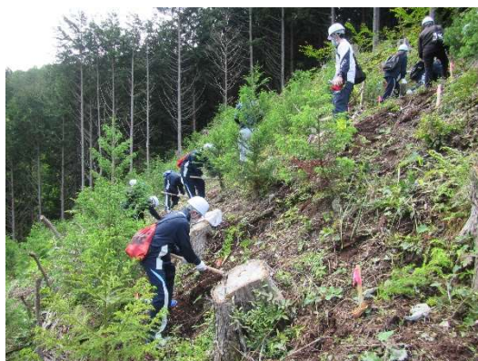
総合的学習の時間を利用した 森林環境教育（植樹体験）

日常生活において森林・林業と関わる機会が少なくなっている中で、主に子ども達を対象とした植林や間伐などの森林づくり活動を通じて、森林・林業について学習する「森林環境教育」を推進するとともに、地域の植樹、樹木保全、里山保全等の活動へ支援を行い森林を地域全体で支える意識の醸成に努める。なお、所有者と町との協定締結に基づき、当該私有林を森林環境教育用のフィールドとしても活用している。