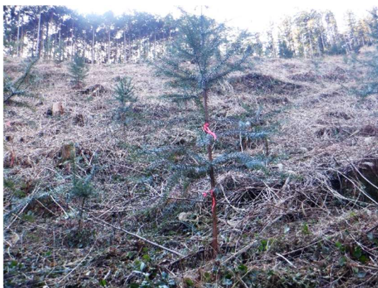
試験地に植栽されたコウヨウザン

早生樹であるコウヨウザンの生育適地における指針は、各項注意書きによるほか「コウヨウザンに関する技術指針（暫定版）（高知県林業振興・環境部 令和3年3月）」による。