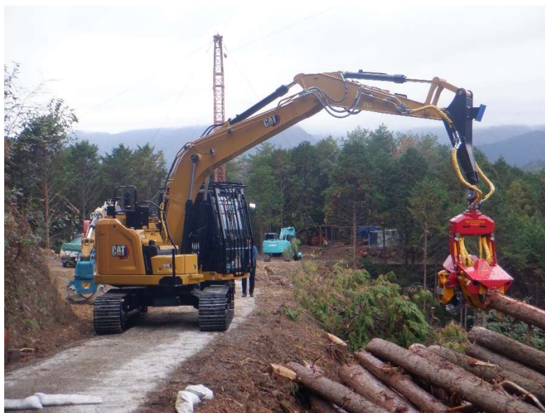
高性能林業機械（ハーベスタ）