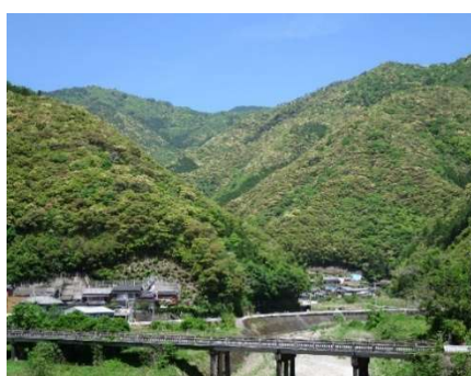
伊野地区の里山地域