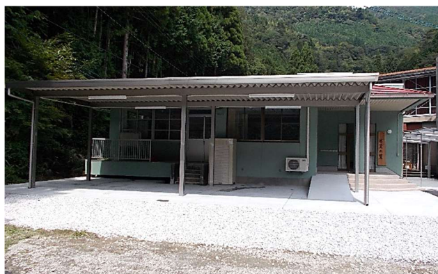
林産物栽培拠点施設 集落活動センター「氷室の里」