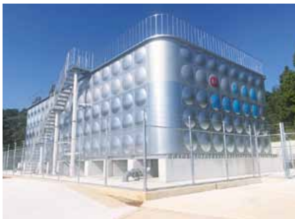
【完成した北山配水池（容量900ト）】

ステンレス製で耐震性に優れ、地震時に一定の揺れを感知すると自動的に配水を遮断し、飲料水を貯留することができます。