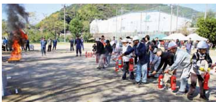
昨年の防災訓練の様子(神谷地区)