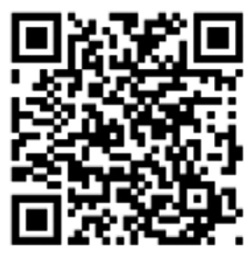
参加登録ページ QRコード

町民の皆様も各地域・職場・学校等で実施してみましよう。 詳細と参加登録は、高知県南海トラフ地震対策課ホームページ又は左のQRコードからお申し込みください。