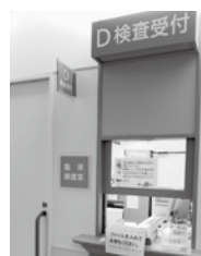
病院1階 臨床検査室

検査室はチーム医療を担う一員として、栄養サポートチームや感染制御チーム、糖尿病教室に参加していますが、今回は『検体検査』について代表的な検査を紹介します。