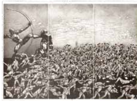
いの町長賞 《Stage Series No.5》張 敏傑 (中国)