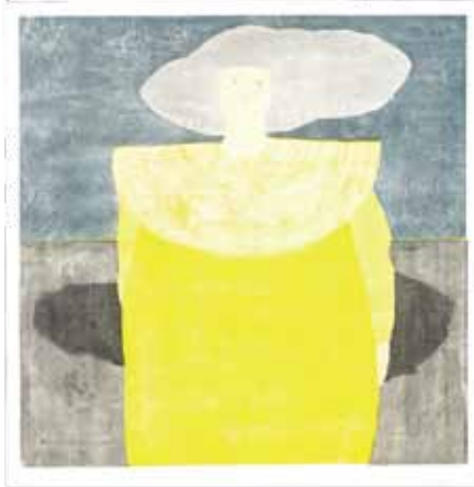
土佐和紙賞 《recollect III》川村 紗耶佳