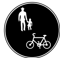
自転車及び歩行者専用