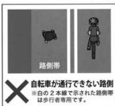
× 自転車が行けない路側 ※白の2本線で示された路側帯は歩行者専用です。