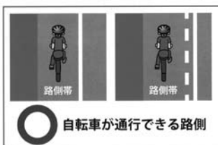
○ 自転車が行ける路側