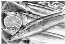
準大賞「おいしい秋」 村上 利久【東京都】