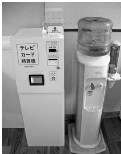
テレビカード精算機・飲用水サーバー