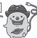
環境キャラクター「エコくん」