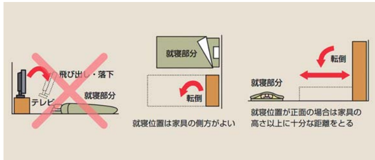
■ 寝ている場所の安全を確保する。

なります。 家具の柱、壁などの補強は行いません。 借屋などの場合、家屋の所有者又は管理者の承諾が必要となります。 設置後、必ず転倒しないことを保障するものではありません。