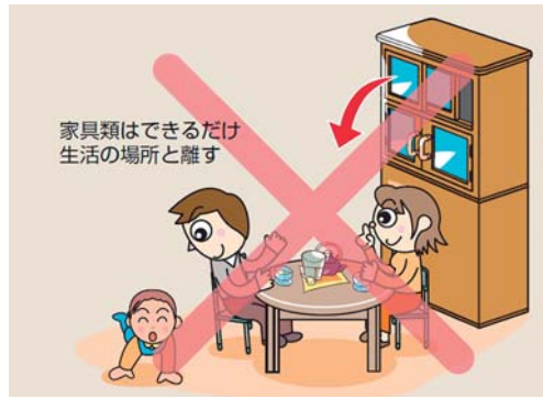
■ 家族の生活空間をできるだけ家具と引き離す。

5月の 消防団行事予定 5月11日(金) 仁淀消防連合会研修会 (土佐和紙工芸村) 5月25日(金) 中央地区消防連絡協議会 総会 (越知町民会館)