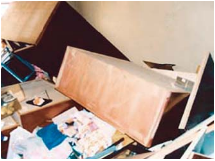
「高知県：南海地震に備えちよぎ」から

阪神・淡路大震災では、死亡やけがの原因の約8割が家具などの転倒落下や家屋の倒壊によるものでした。家具の固定と家屋の耐震補強をすることで、揺れによる被害をほとんどなくすることができます。 町では、平成24年度から、自分で転倒防止対策のできない世帯に対して、取付金具代金はご負担いただき、委託業者に取付作業を依頼します。