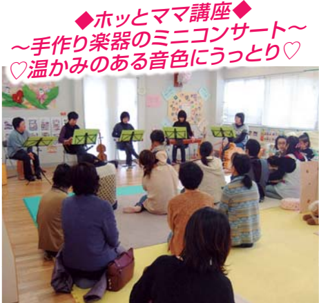
◆ホットママ講座◆ ~手作り楽器のミニコンサート~ ♡温かみのある音色にうっとり♡

休日に来てくれた高知大の学生さん、健康センターを利用されている高齢者の皆さん、また、幼稚園の帰りに遊びに寄ってくれる元気なお兄ちゃんやお姉ちゃんなど、たくさんの方々との出会いによって、ひろばの親子の変化や成長が見られます。子育て支援に関心をお持ちの地域の方との交流も図ることができれば幸いです。お気軽にお立ち寄りください。本年度もよろしくお願ひします。