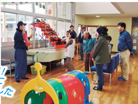
合同避難訓練 南海大地震に備えて! 高齢者の方とも一緒に 消防士さんの話をききました