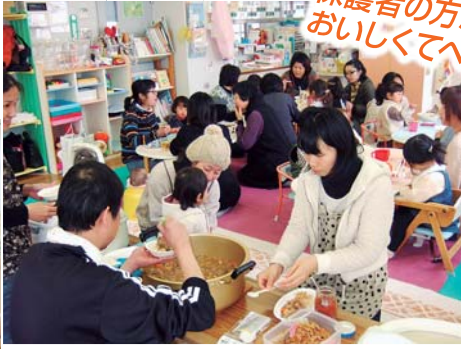
コンサートの後は・・・ 保護者の方が作ってくれた牛スジ丼!! おいしくてペロリと食べちゃいました!