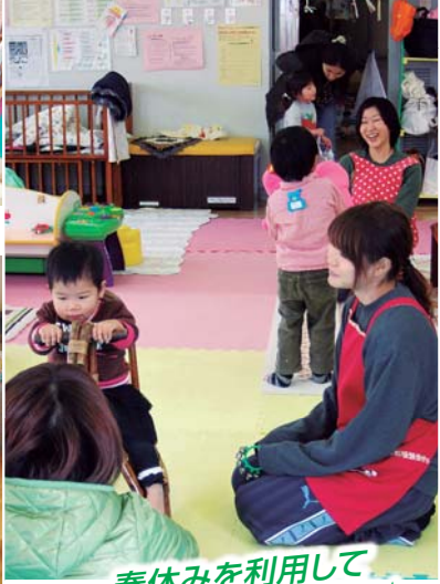
春休みを利用して ★大学生ボランティア★