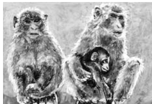
優秀賞「絆」 北海道 菅原 勇