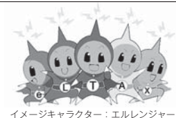
イメージキャラクター：エルレンジャー

町では、地方税ポータルシステム(eLTAX)を利用して個人住民税の給与支払報告書、法人町民税の申告書、固定資産税(償却資産)の申告等の手続きを行っています。ご利用については、eLTAXホームページをご覧ください。