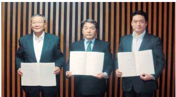
(株)加寿翁コーポレーションとの協定締結式 左：塩田町長、中央：竹内社長、右：尾崎知事