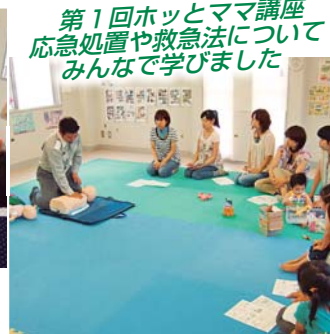
第1回ホッとママ講座 応急処置や救急法について みんなで学びました

★ひろばでの遊びや生活の様子、各行事等について、詳しくはHPでご紹介しています。★