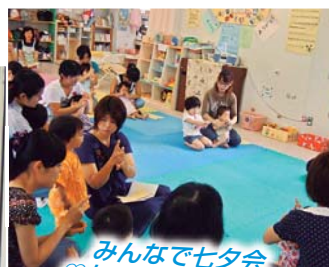
みんなで七夕会 ♡たのしい歌やお話 おもしろい体操も 楽しんだね♡