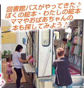
図書館バスがやってきた♪ ぼくの絵本・わたしの絵本 ママやおばあちゃんの 本も探してみよう!