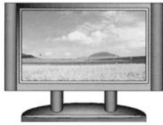
デジタルチューナー内蔵テレビ (液晶テレビ・プラズマテレビなど)