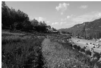
グリーン・パークほどの花壇