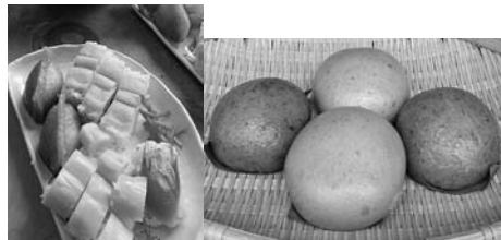
町内のおいしいもの