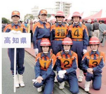
出場した選手の皆さん