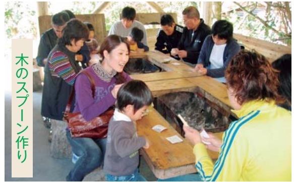
木のスプーン作り

む森」パートナーズ協定に基 づく活動で、森林の保水力向 上など水源かん養に貢献する ことを目指し、協働で森づく りを行うものです。 当日は晴天にも恵まれ、間 伐を実施したことで林内に太 陽の光が差し込み、間伐の大 切さを学ぶことができました。 また、午後からは間伐材を 利用した木のスプーン作りを 行い、夢中になって紙ヤスリ で磨きあげ、「木のぬくもり を感じる。」「どれも形が違 うし、木目がきれい。」などの感 想も聞かれ、大人から子ども まで楽しんでいました。