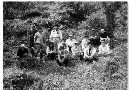
草刈り、お疲れさまでした

これからも継続的にお世話をし、早くいろんなフルーツが実ることをみんなで願っています。