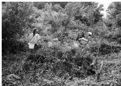
養分をとって、大きく育てよ