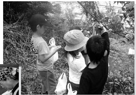
うれしいな、 たくさん実っているよ