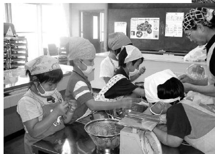
おいしい梅ジュースを作るぞ