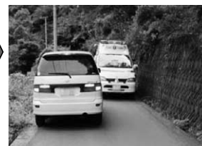
■すれ違いできない救急車