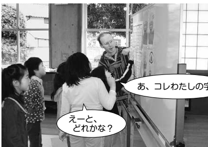
ローマ字で自分の名前を書いてみよう