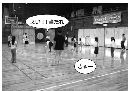
ドッチビーの試合