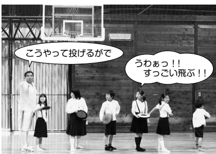
ドッチビーのディスクの投げ方練習

ござの上でくつろいで勉強。アルファベットの練習から始め、簡単な自己紹介ができるようになりました。英語の発音は難しいけど、みんな大きな声でいっぱい英語を楽しみました!