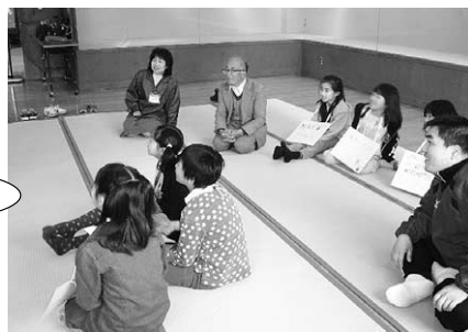
英語で自己紹介。みんな先生に注目