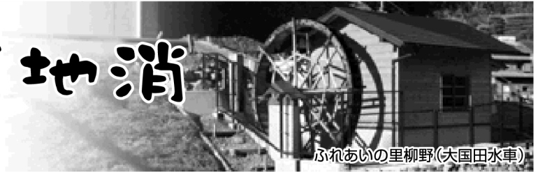
ふれあいの里柳野(大国田水車)