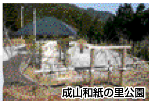
成山和紙の里公園

また、この公園から1kmのところには、多目的施設「土佐七色の里」と健康遊歩道「はだしの小道」があります。