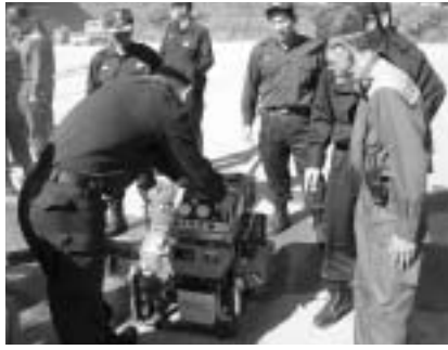
ポンプ取扱訓練(吾北方面隊)

で実施されました。それぞれの訓練では、消火作業の技術力向上が図られたとともに、活動時の各分団との円滑な連携の確認ができました。