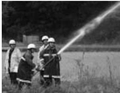
火点への放水訓練(伊野方面隊)