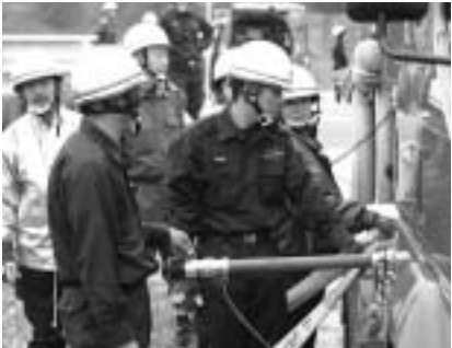
中継送水におけるポンプ車操作訓練(伊野方面隊)