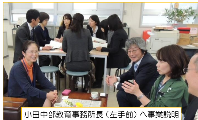
小田中部教育事務所長(左手前)へ事業説明