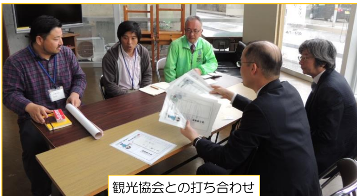
観光協会との打ち合わせ

更に、高知県教育委員会にも、この事業をよりご理解いただくために教育次長も同行して、事業説明を行いました。そして「第2次の町の教育振興基本計画」にも明記しているように「ほめ言葉のシャワーのまちを目指して」取組を推進します。