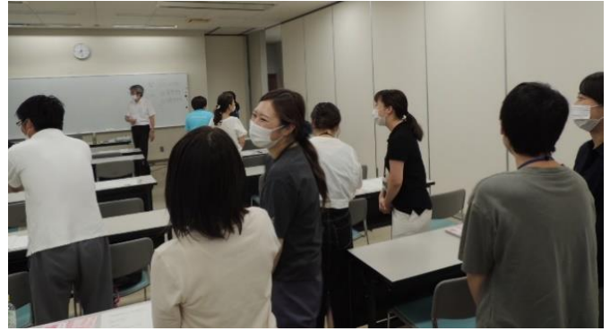
参加者の皆さんが笑顔で対話する様子

人を嫌いになるのは、相手のことを知らないから。知れば好きにはなれなくても嫌いにはならない。安心できる居場所があるからこそ自信が持てます。お互いを認めて大切にしようことが大切です。