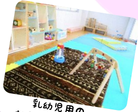
乳幼児用の おもちゃが充実♪