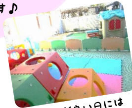
お天気が良い日には テラスやお庭遊びも♪