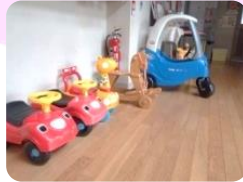
乗り物に乗って のびのび遊べる♪